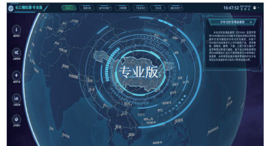
图 2 长江模拟器 V1.0 软件平台